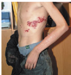
На рис.: Проявление СПИДа – саркома Капоши на коже ВИЧ-инфицированного.

Сочетание иммунодефицита у потребителя солей и ВИЧ-инфекции приводит к наиболее тяжелому течению СПИДа, с быстрым появлением злокачественных опухолей.